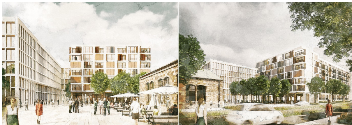
Visualisierungen Büro- und Wohnensemble auf Baufeld 3

Wie unterschiedlich die Herangehensweise in der Entwicklung von Immobilien sein kann, veranschaulichen die jüngsten Projekte von DIRINGER & SCHEIDEL (D&S) auf den Baufeldern 1 und 3 im Mannheimer Glückstein-Quartier.