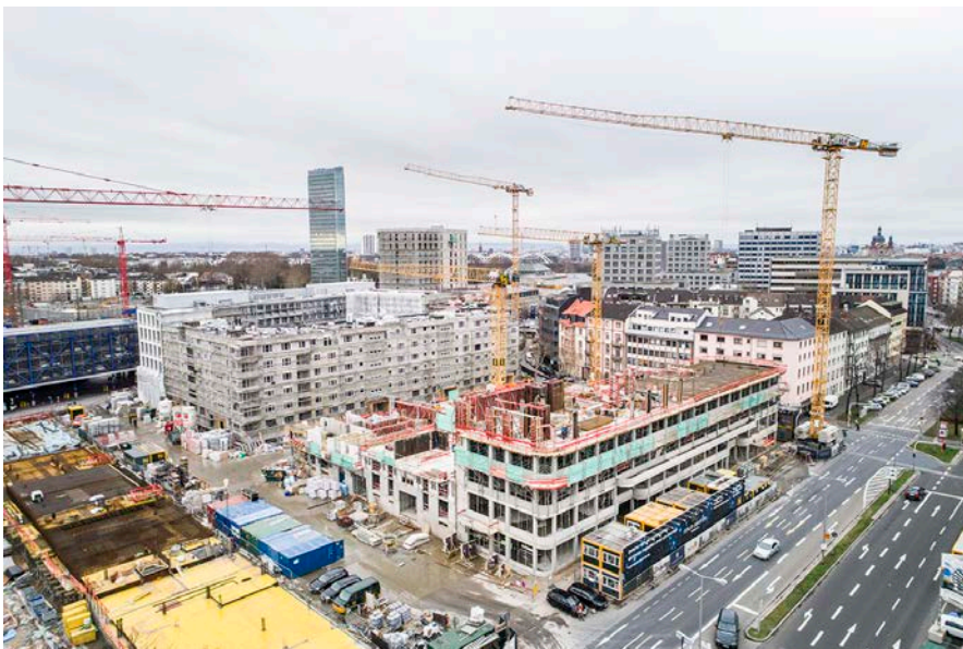
Das Kepler-Quartier im Januar 2018: Im Vordergrund der Rohbau des Bürohauses in der Reichskanzler-Müller-Straße.

Pressekontakt: Beate Baumann, Unternehmenskommunikation D&S Unternehmensgruppe, beate.baumann@dus.de, Tel. 0621- 8607-207, Anschrift: Wilhelm-Wundt-Str. 19, 68199 Mannheim