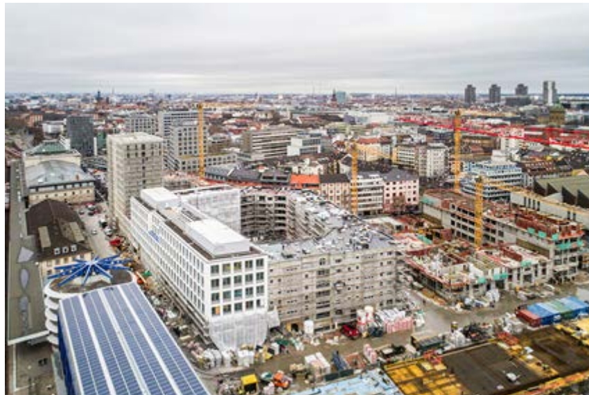
Das Kepler-Quartier im Januar 2018: In das Bürohaus in der Heinrich-von Stephan-Straße (li.im Bild) werden die ersten Mieter im März einziehen.

Pressekontakt: Beate Baumann, Unternehmenskommunikation D&S Unternehmensgruppe, beate.baumann@dus.de, Tel. 0621- 8607-207, Anschrift: Wilhelm-Wundt-Str. 19, 68199 Mannheim