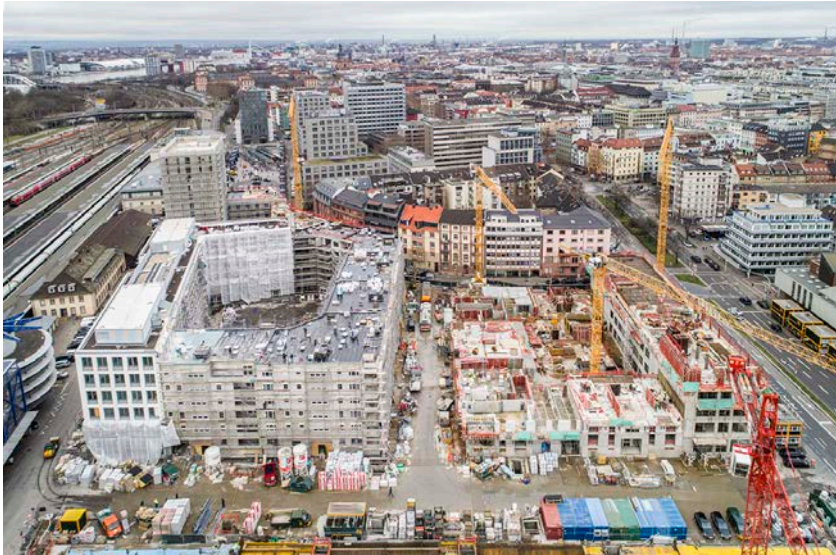
Das Kepler-Quartier im Januar 2018: Links das Bürogebäude in der Heinrich-von-Stephan-Straße, in das die ersten Mieter im März 2018 einziehen werden.