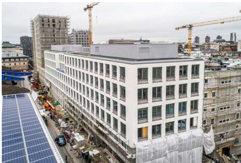
Das Kepler-Quartier im Januar 2018: In das Bürogebäude in der Heinrich-von-Stephan-Straße werden die ersten Mieter im März 2018 einziehen.